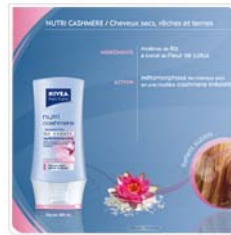
Beiersdorf Présentation produit