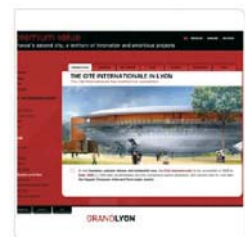
Grand Lyon Support de formation