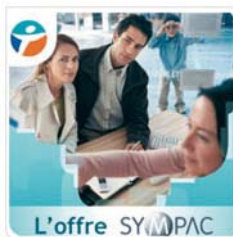
Bouygues Télécom Formation interne