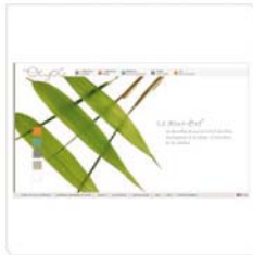
Ekyog Site e-commerce