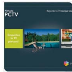
Pinacle Animation promotionnelle