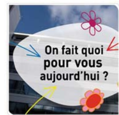
Monoprix Film présentation métier