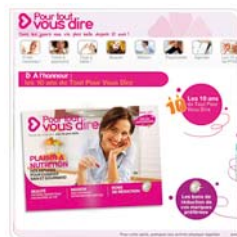
Unilever Site évènementiel