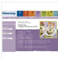
Biocoop Site portail