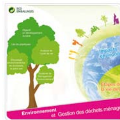
EcoEmballages CD-Rom recyclage