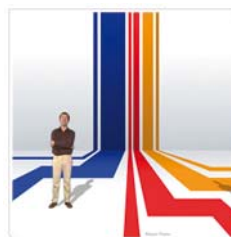
Cemex CD-Rom institutionnel