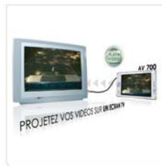
Archos Mode d'emploi animé