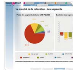
Eugène Perma Book de vente